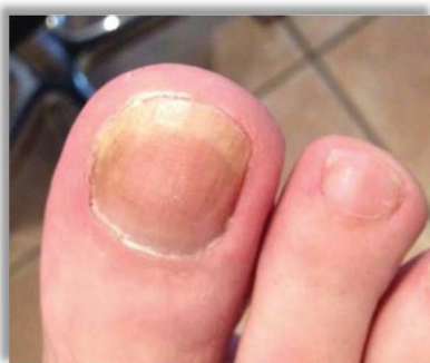
Po 4,5 miesiącach terapii