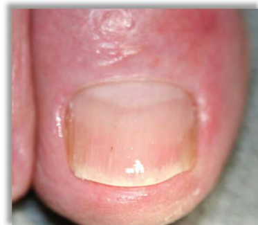
Po 7 tygodniach terapii