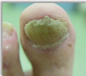
Po 13 tygodniach terapii

Paluch lewej stopy, mężczyzna, 82 lata, cukrzyca, neuropatia, onychomikoza.