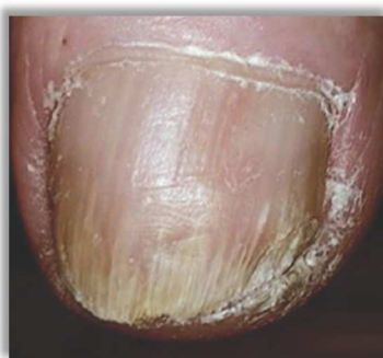
Po 5 miesiącach terapii

Paluch prawej stopy, kobieta, 67 lat, onychomikoza.