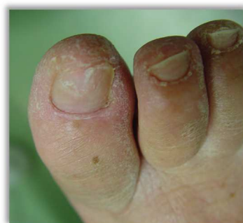
Po 6 tygodniach terapii