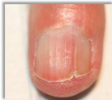
Po 8 tygodniach terapii