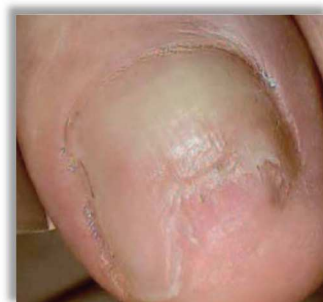
Po 2 miesiącach terapii