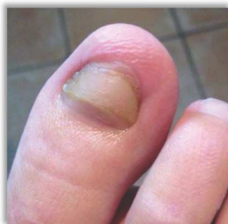
Po 4,5 miesiącach terapii

Paluch lewej stopy, kobieta, 25 lat, onychomikoza.