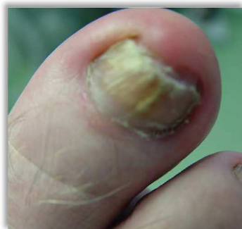
Po 10 tygodniach terapii

Paluch prawej stopy, mężczyzna, 69 lat, onychomikoza.