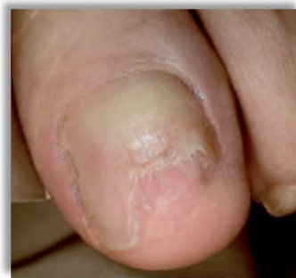
Po dwóch miesiącach terapii