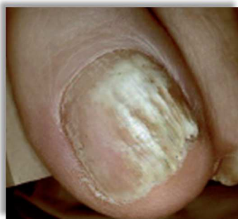
Diagnoza - Onychomikoza