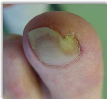
Po 6 tygodniach terapii

Paluch lewej stopy, mężczyzna, 70 lat, cukrzyca typu 2 (Diabetes mellitus) angiopatia, neuropatia, onychomikoza.