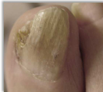
Po 16 tygodniach terapii