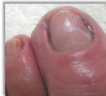
Po 3 miesiącach terapii