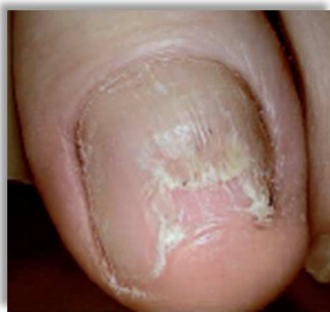
Po jednym miesiącu terapii