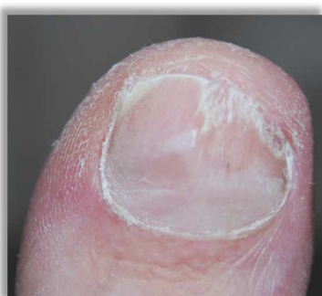
Po 16 tygodniach terapii

Duży palec prawej stopy, mężczyzna, 45 lat, onychomikoza.